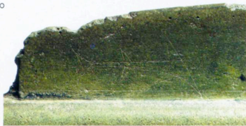
サメの絵が描かれた銅鐸 出土地不明

第1回 4 / 29（土・祝）、第2回 5 / 13（土） 第3回 5 / 20（土）、第4回 6 / 3（土） 第5回 6 / 10（土）、第6回 6 / 17（土）