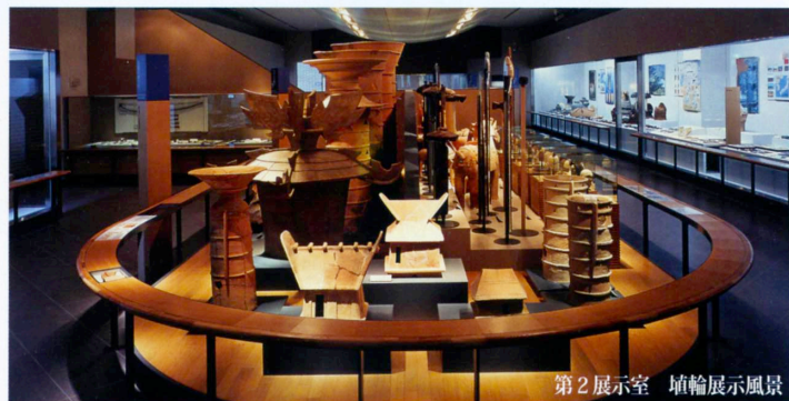
第2展示室 埴輪展示風景